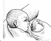
طرز صحیح گرفتن سینه